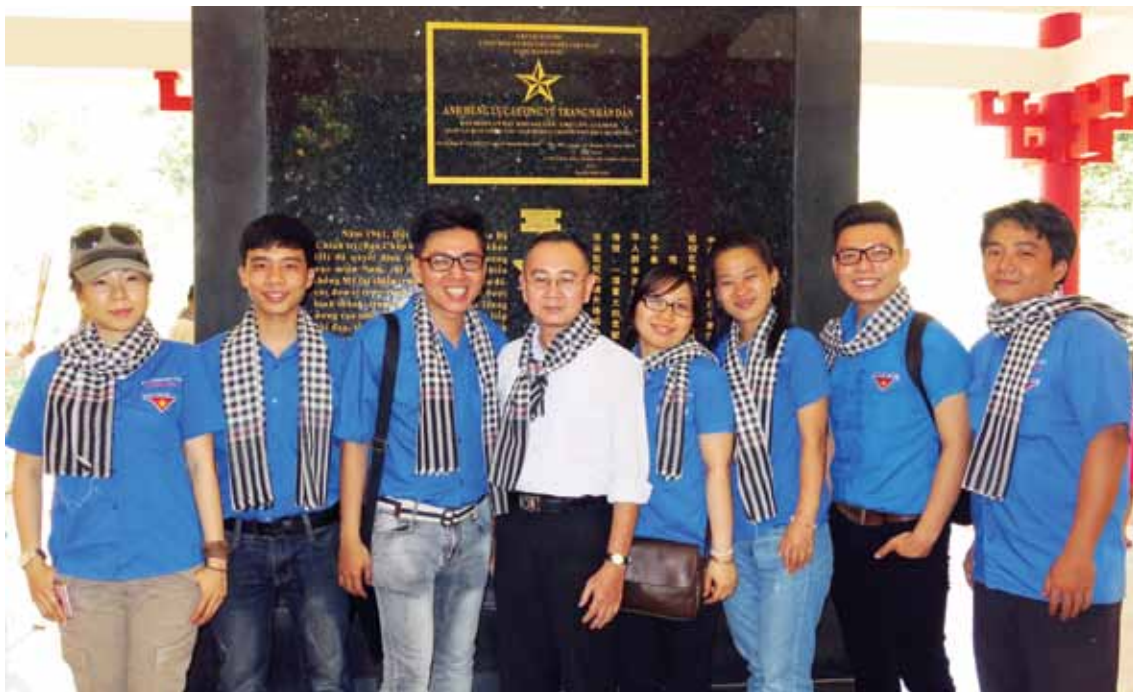
Chi đoàn báo Sài Gòn Giải Phóng Hoa văn tổ chức về nguồn tìm hiểu Bìa Truyền thống cách mạng người Hoa tại Trung ương Cục miền Nam (Tây Ninh)