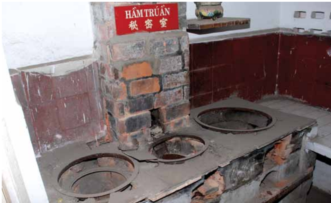
Hầm trú ẩn tại di tích Cơ sở bí mật của Thành ủy Sài Gòn – Gia Định giai đoạn 1968-1972, (số 91 Phạm Văn Chí P.1, Q.6. TP. Hồ Chí Minh)