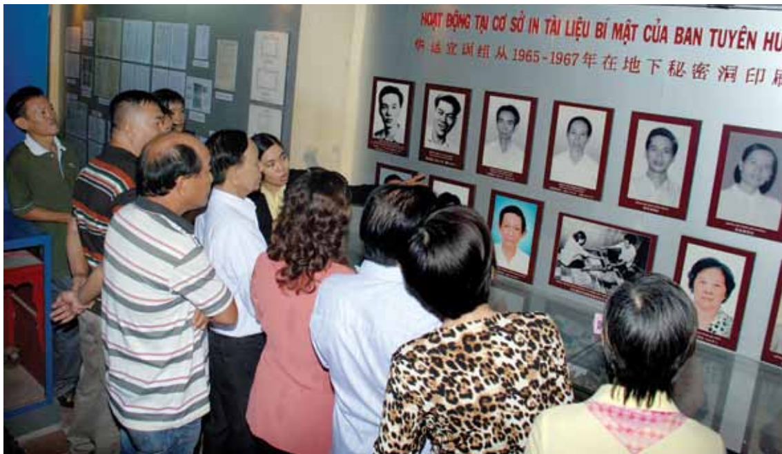
Đoàn Văn nghệ sĩ Hội Văn học Nghệ thuật các dân tộc thiểu số Thành phố về nguồn tham quan tìm hiểu di tích lịch sử cấp quốc gia – Hầm bí mật in tài liệu của Ban Tuyên huấn thuộc Ban Hoa vận T4 trong thời kỳ chống Mỹ cứu nước tại số 341/10 đường Gia Phú, P.1, Q.6. TP. Hồ Chí Minh