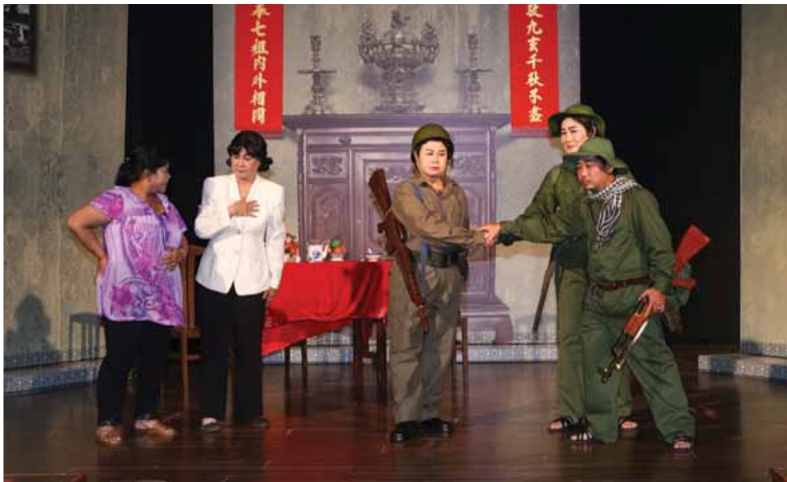
Văn nghệ sĩ Đoàn nghệ thuật Triều Châu biểu diễn vở kịch “Nghĩa tình năm ấy - 1968” nhân Kỷ niệm 50 năm Tổng tiến công và nổi dậy Xuân Mậu Thân 1968