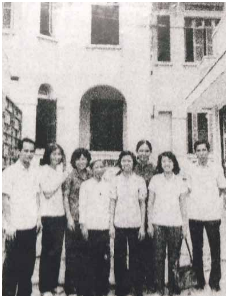
Lực lượng vũ trang cánh Hoa vận T4 tấn công bót Hòa Hòa đợt 1 - Tết Mậu Thân