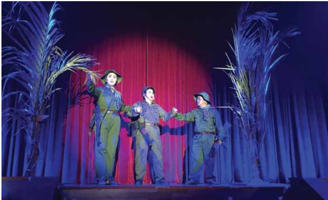
Diễn viên Đoàn nghệ thuật ca kịch Triều Châu biểu diễn vở kịch " Nghĩa tình năm ấy - 1968 " nhân Kỷ niệm 50 năm Tổng tiến công và nổi dậy Xuân Mậu Thân 1968