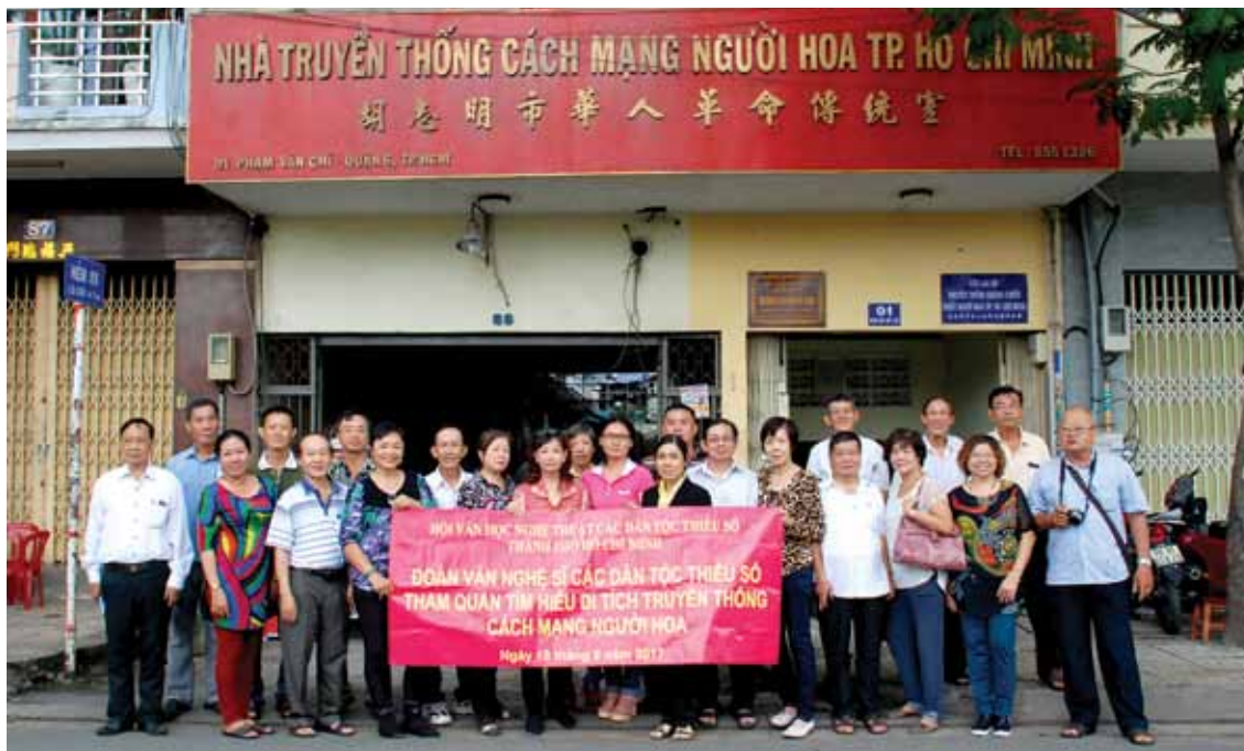
Đoàn Văn nghệ sĩ Hội Văn học Nghệ thuật các dân tộc thiểu số Thành phố về nguồn tham quan Nhà truyền thống cách mạng người Hoa Thành phố tìm hiểu di tích Cơ sở bí mật của Thành ủy Sài Gòn – Gia Định giai đoạn 1968-1972, (số 91 Phạm Văn Chí P.1, Q.6. TP. Hồ Chí Minh)