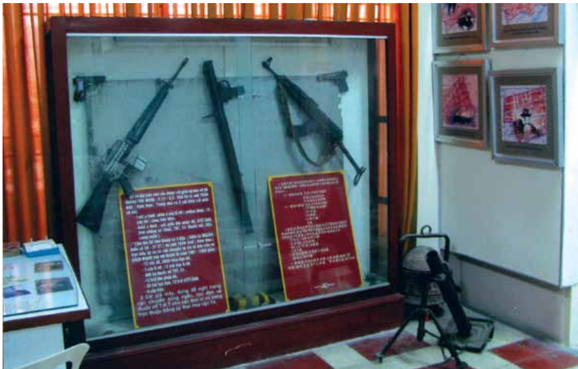
Một số vũ khí của đơn vị Hoa vận được trưng bày tại Nhà truyền thống cách mạng người Hoa