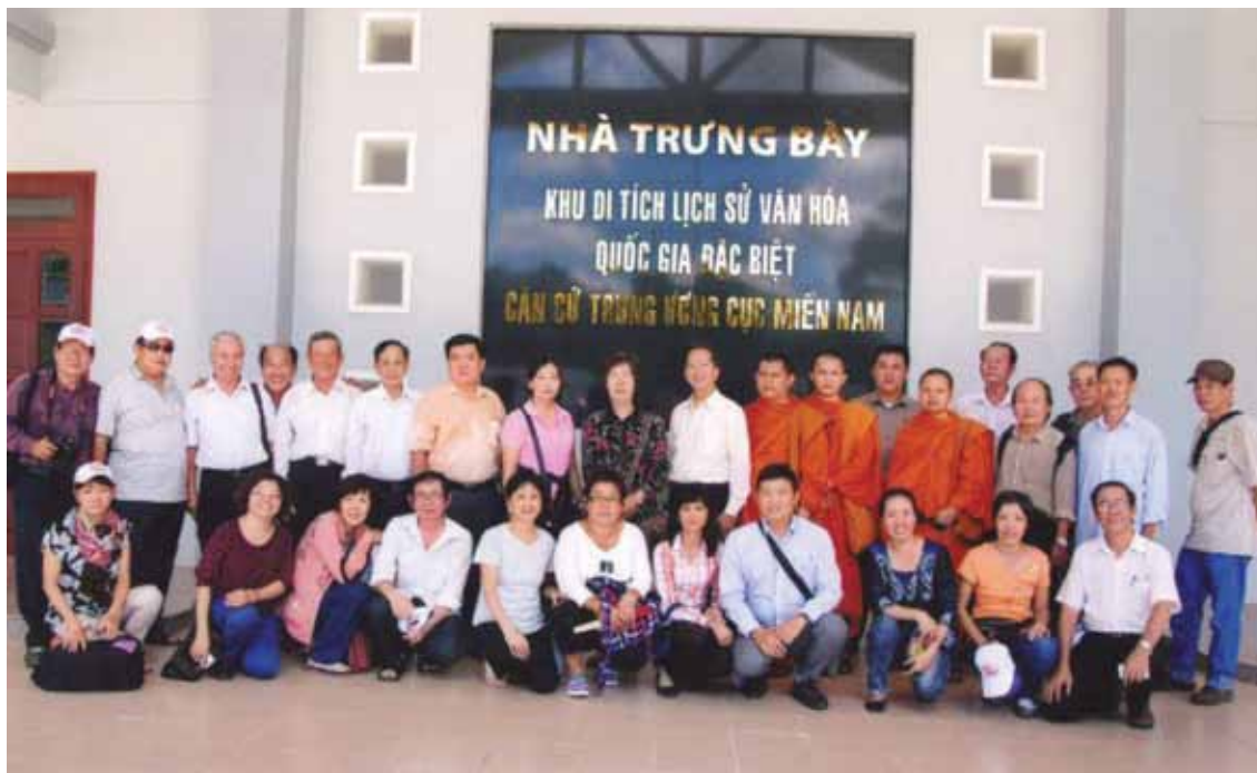
Đoàn văn nghệ sĩ các dân tộc thiểu số thành phố tham quan, tìm hiểu Khu Di tích lịch sử Văn hóa Quốc gia Căn cứ Trung ương Cục miền Nam (Tây Ninh)