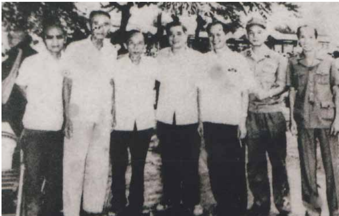
Cố Tổng Bí thư Nguyễn Văn Linh thăm các cán bộ lão thành người Hoa