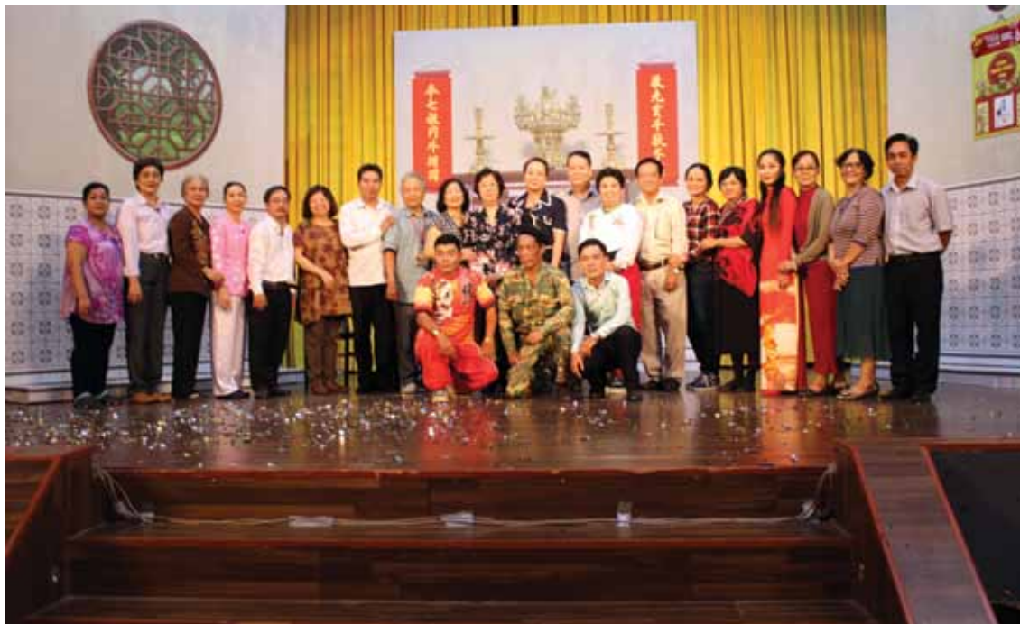
Văn nghệ sĩ Đoàn nghệ thuật Triều Châu biểu diễn vở kịch “ Nghĩa tình năm ấy - 1968 ” nhân Kỷ niệm 50 năm Tổng tiến công và nổi dậy Xuân Mậu Thân 1968