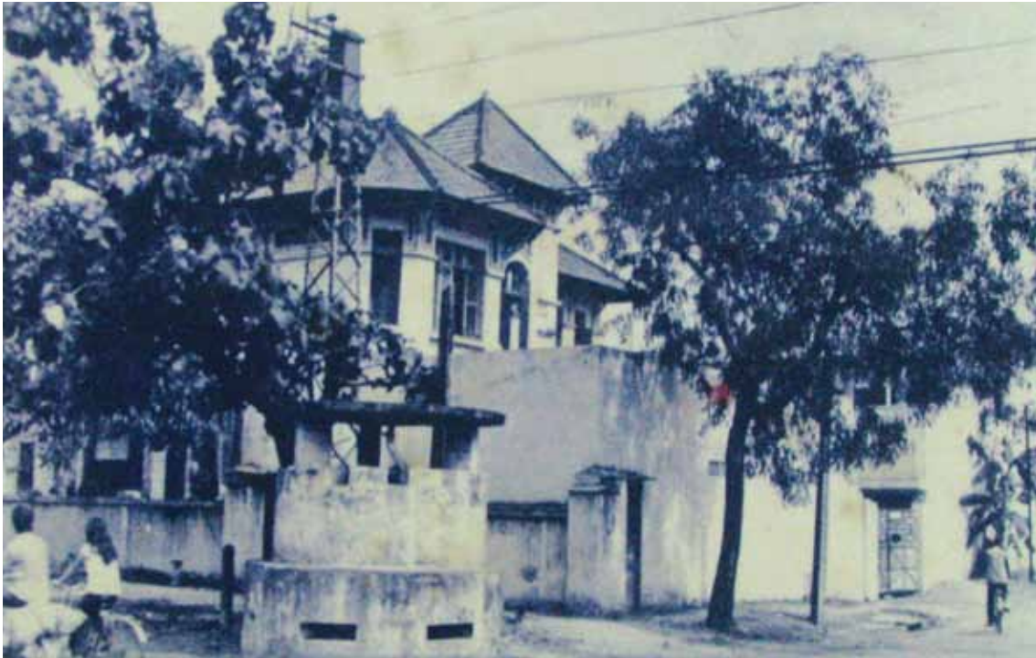
Bót Hòa Hòa (Ty cảnh sát đặc biệt Chợ Lớn) là sào huyệt của bọn Mỹ ngụy dùng giam cầm tra tấn các chiến sĩ cách mạng.