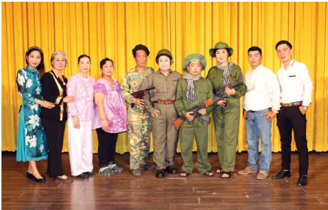
Tập thể diễn viên vở tuồng "Nghĩa tình năm ấy - 1968" do Đoàn ca kịch Thống nhất đội Triều Châu biểu diễn