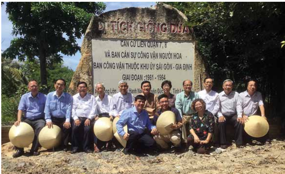
Lãnh đạo Hội Văn học Nghệ thuật các dân tộc thiểu số Thành phố Hồ Chí Minh tham quan Di tích Giồng Dừa – Căn cứ liên quận 7, 8 và Ban Cán sự Công vận người Hoa thuộc Khu ủy Sài Gòn – Gia Định tại huyện Đức Hòa, tỉnh Long An