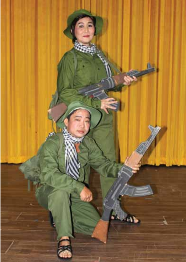
Văn nghệ sĩ Đoàn nghệ thuật Triều Châu biểu diễn vở kịch "Nghĩa tình năm ấy - 1968" nhân Kỷ niệm 50 năm Tổng tiến công và nổi dậy Xuân Mậu Thân 1968