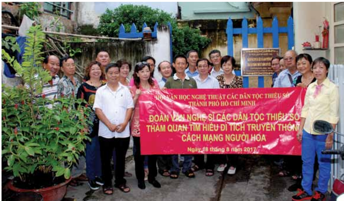
Đoàn Văn nghệ sĩ Hội Văn học Nghệ thuật các dân tộc thiểu số Thành phố về nguồn tham quan tìm hiểu di tích lịch sử cấp quốc gia – Hầm bí mật in tài liệu của Ban Tuyên huấn thuộc Ban Hoa vận T4 trong thời kỳ chống Mỹ cứu nước tại số 341/10 đường Gia Phú, P.1, Q.6. TP. Hồ Chí Minh