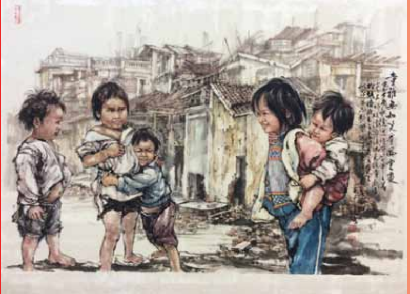
Nụ cười thơ ngây trong Tết Mậu Thân 1968 (Trương Lộ)