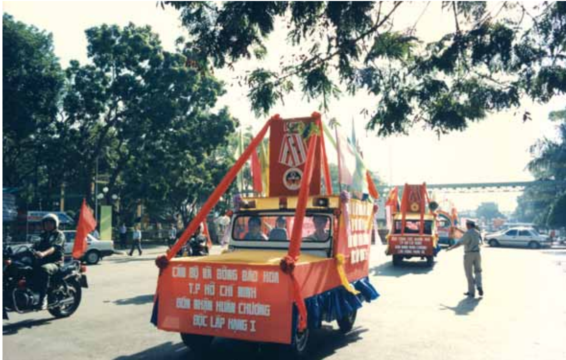
Đoàn xe đón rước Huân chương Độc lập hạng nhất cho cán bộ, chiến sĩ, đồng bào người Hoa Thành phố